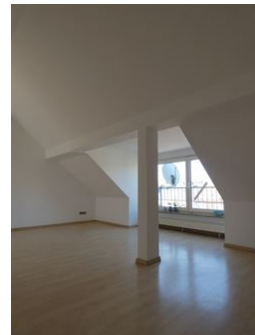
Viel Licht und Raum!