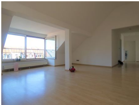
Wohlfühl-Wohnen bis unters Dach!