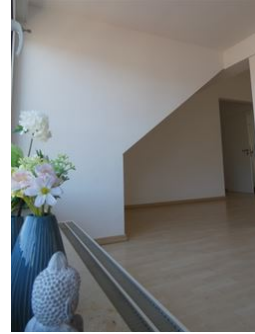
Heimkommen & Ankommen!