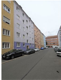
Vor der Haustüre