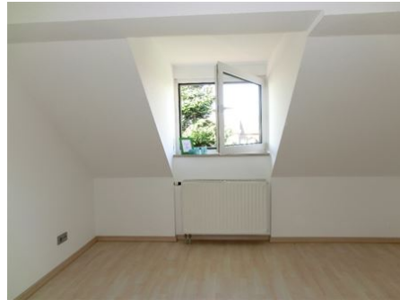
Perfekt fürs Homeoffice!