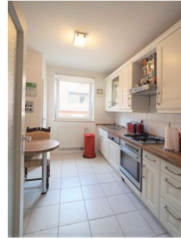
Für Ihre Kochkünste!