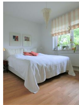
Hier schlafen Sie angenehm!