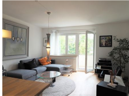
Relaxen, ankommen, genießen!