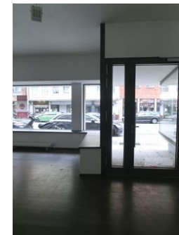
Hier werden Sie gesehen!