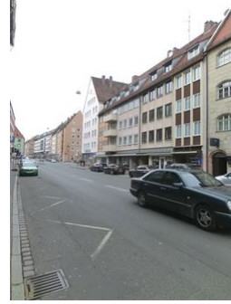
Innere Laufer Gasse