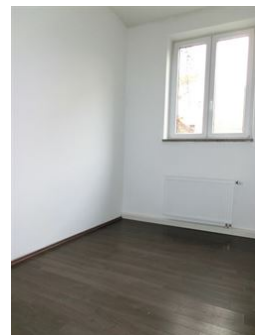
Büro | Aufenthaltsraum usw.