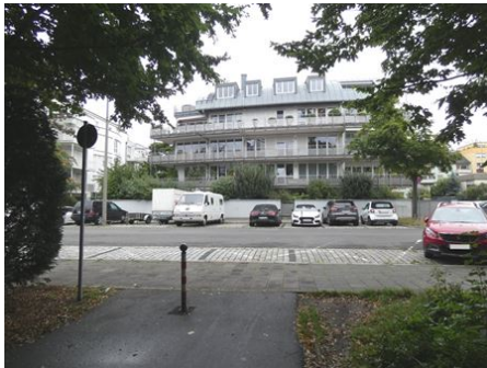
Symbiose: Stadtpark und Balkon!