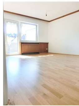
Freundlicher, heller Look!