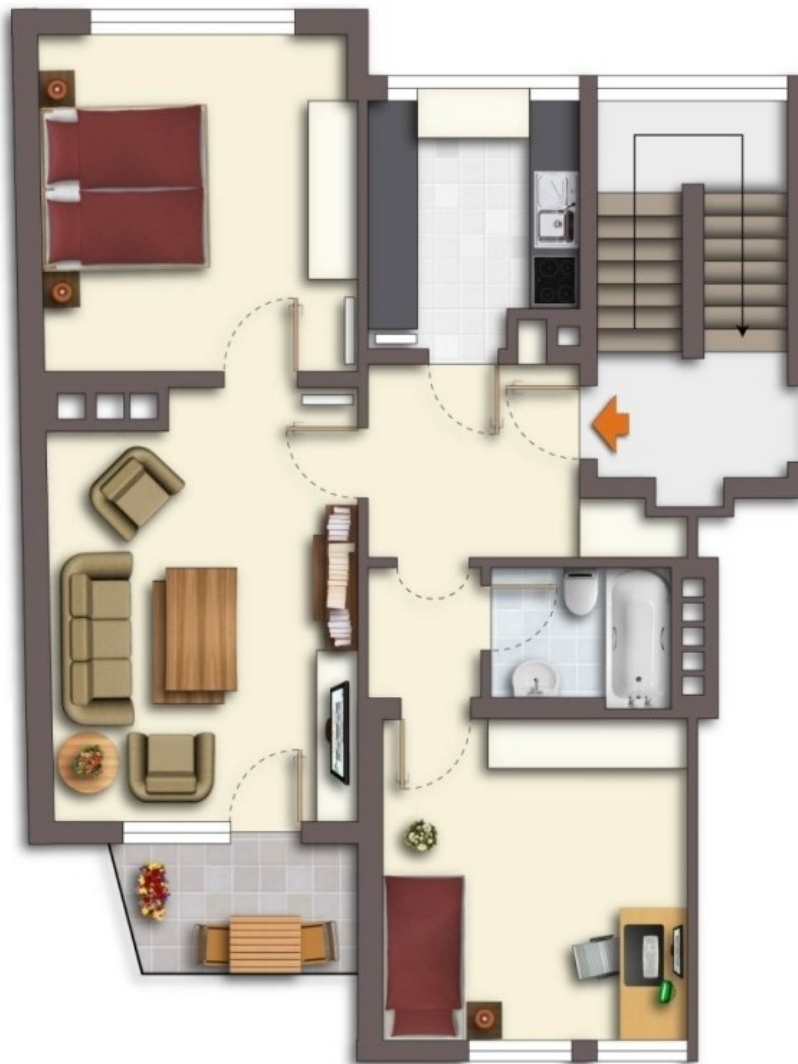
Grundriss | 3. Obergeschoss

illustriert, nicht zur Maßentnahme geeignet