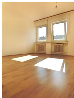
Home Office leicht gemacht!