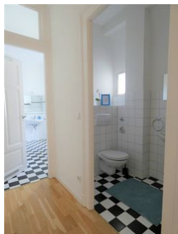
Alles fließt! Freundlicher, heller Look!