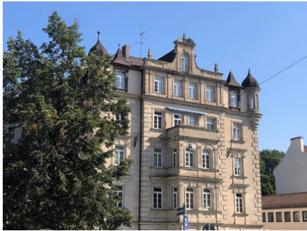
Wow! Wohnen deluxe!