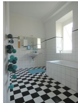
Bad mit Fenster!