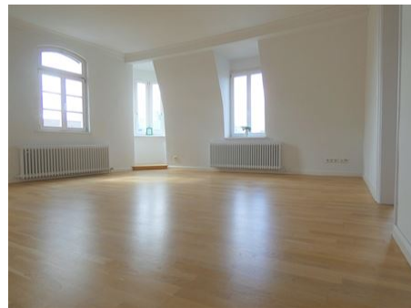
Wohnen mit WOW-Effekt!