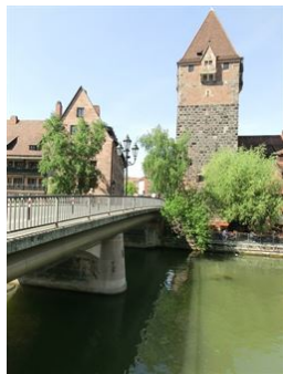
Kurze Wege überall hin!