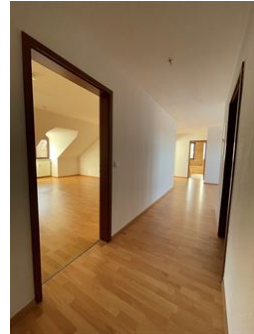
Zu Hause ankommen!