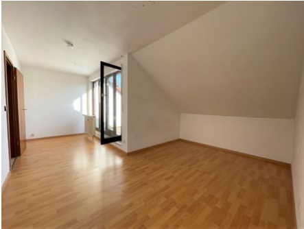
Wohnzimmer mit Panoramafenster!