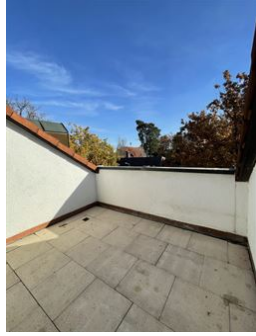
... und eine zweite Terrasse!