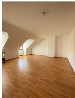
Viel Platz zum Spielen!