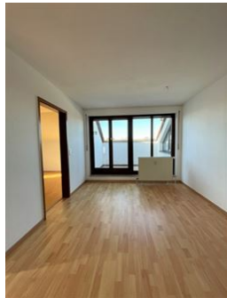
Essplatz mit Ausblick!