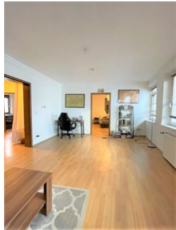
Wohnzimmer zum Relaxen!