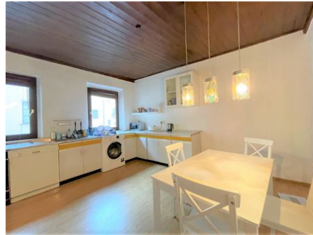
Essen mit Freunden!