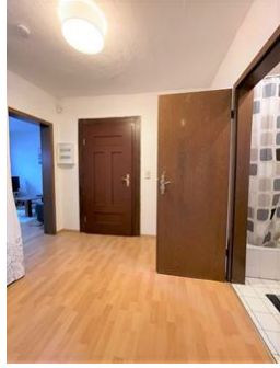
Heimkommen & wohlfühlen!