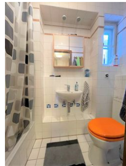
Klein, aber fein!