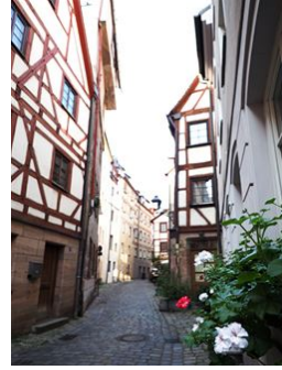
Mitten drin in Nürnberg!