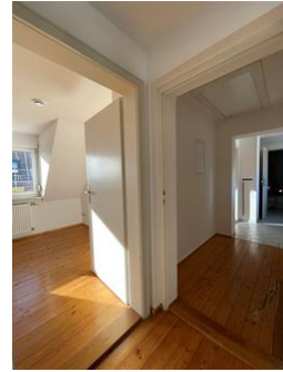
Heimkommen & Ankommen!