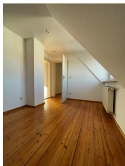
Perfekt fürs Homeoffice!