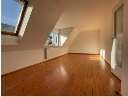
WOW- was für ein Wohngefühl!