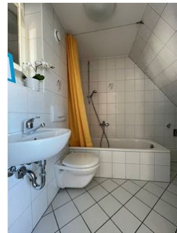
Bad mit Badewanne!