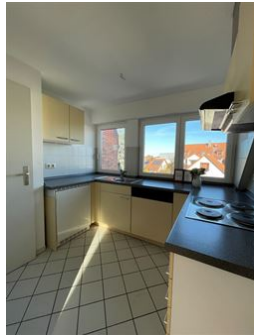
Einbauküche- kochen für Freunde!