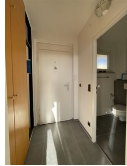
Heimkommen & wohlfühlen!