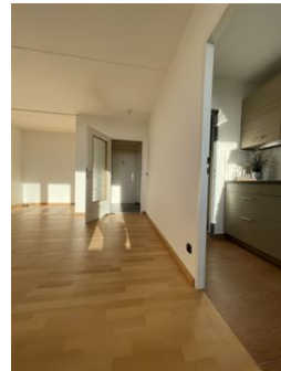
So geht guter Wohnstil!