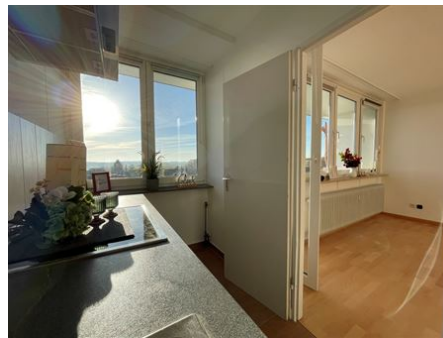
Is this love?