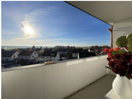
Wow - was für ein Ausblick!