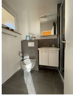
Helles & neues Bad!