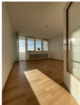
Die Kraft des Wohlfühlens!