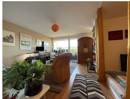
Offenes Wohnen | Leben