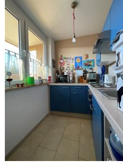
Küche mit Einbauküche