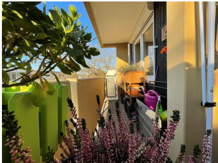
Die Sonnenseite des Lebens!