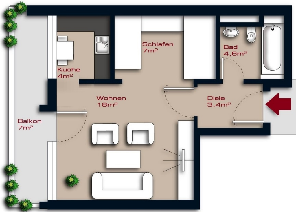
Grundriss 2. OG

illustriert, nicht zur Maßentnahme geeignet