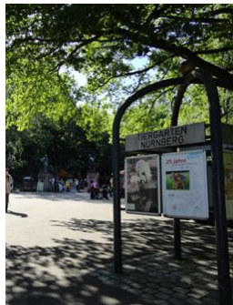
Tiergarten um die Ecke!