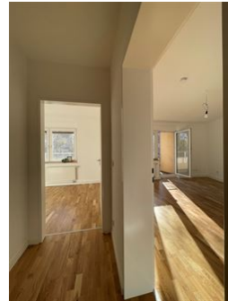
Hier ist es schön zu wohnen!