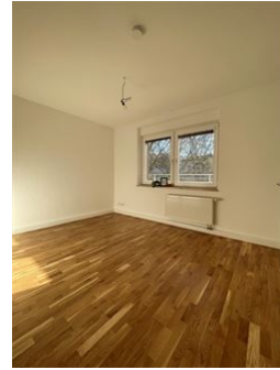
Perfekt fürs Homeoffice!