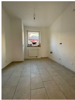
Kochen für Freunde!