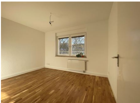
Homeoffice leicht gemacht!