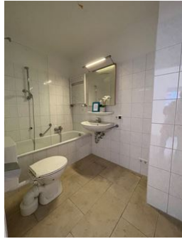
Bad mit Badewanne!