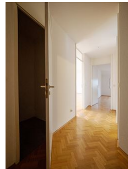
Praktisch - mit Abstellraum!