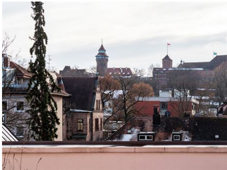
Ein Zuhause mit Seele!