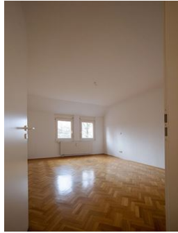
Hier schlafen Sie gut!