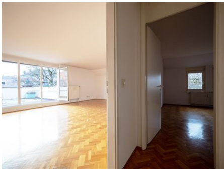
Hell & offen!