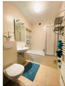
Bad mit Badewanne!