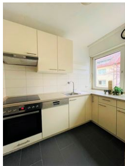
Kochen für Freunde!