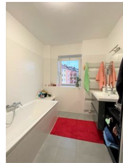
Badezimmer mit Fenster!