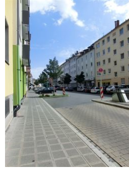
Top zentrale Lage!