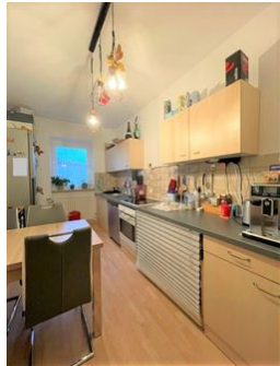
Kochen für Freunde!