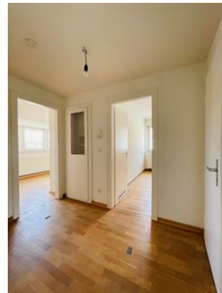
Heimkommen & Ankommen!