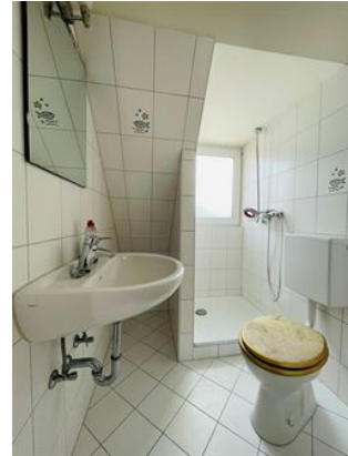
Duschbad mit Fenster!