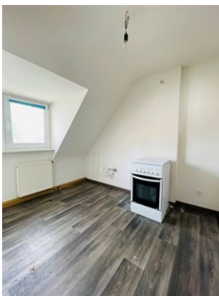
Kochen für Freunde!