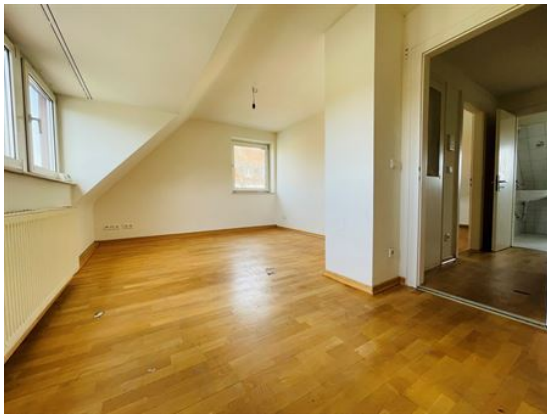
Wohnen unterm Dach!