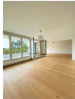
Ganz viel Platz!