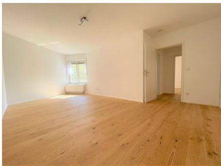
Der Weg ins Glück!