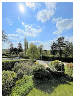
Gleich am Wiesengrund!