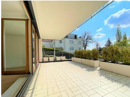
Der große Sonnentraum!