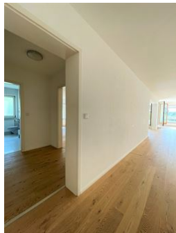
Freundlicher, heller Look!