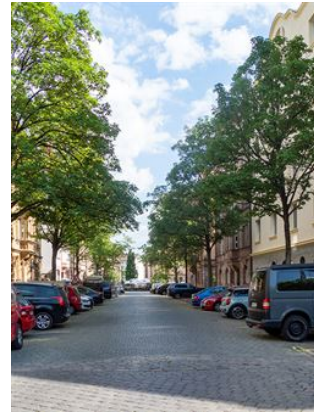
Hier will ich wohnen!