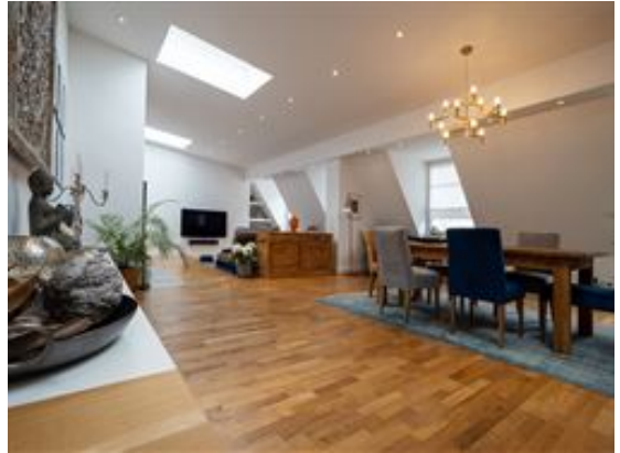
19 Uhr Dinner!