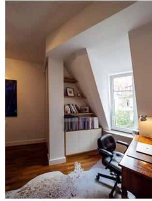
Homeoffice leicht gemacht!