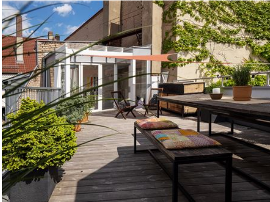
Relaxen - Sonnenschein - Entspannen!