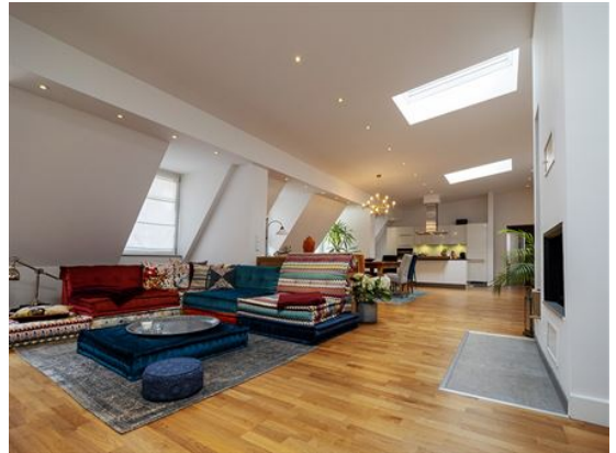
Hier bekommen Sie alles!