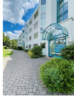
Ruhige und gepflegte Anlage!