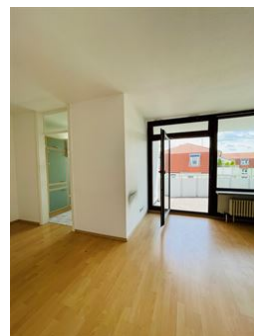
Für alles den perfekten Platz!