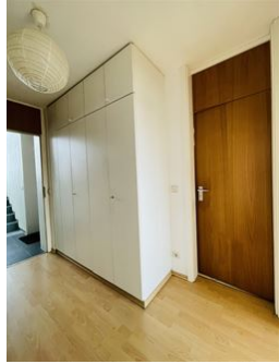
Eingang zum Wohnglück!