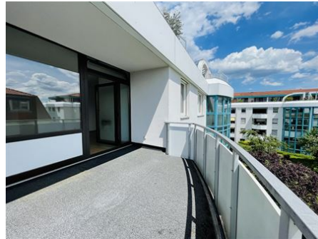
Sonne und Glück!