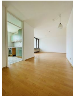
Freundlicher, heller Look!