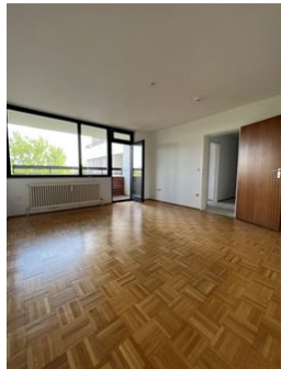
Hier will ich wohnen!