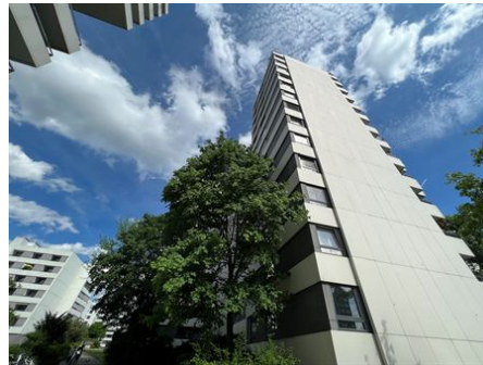
Leben in der Norikus Anlage