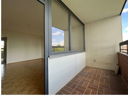
Relaxen - Sonnenschein - Entspannen!