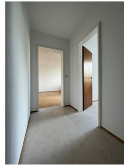
Freundlicher, heller Look!