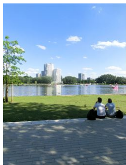
Entspannung und Relaxen