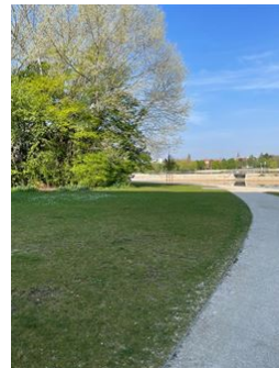
Naherholungsgebiet Wöhrder See!