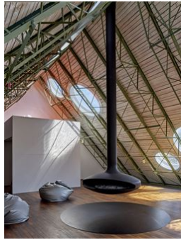
Dachhalle mit Kugelfenstern