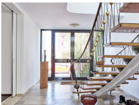
Mit dem Charme einer Lobby