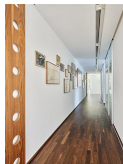
Alles ist einmalig