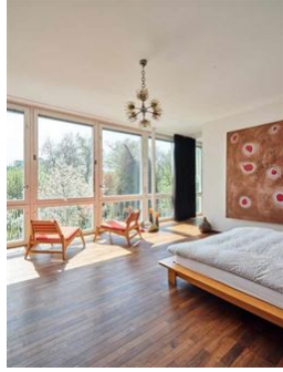
Ein aussichtsreiches Erwhachen