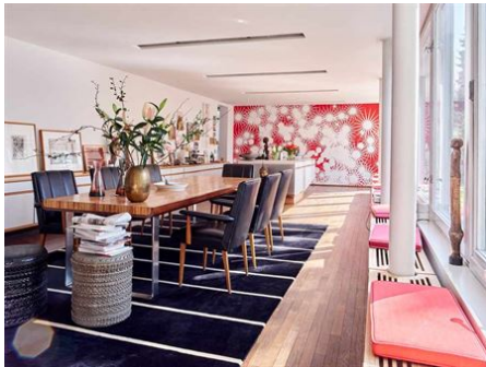
Essen- Wohn- Lounge