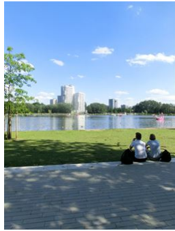
Entspannen am Wöhrder See!