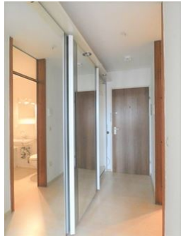
Alles was man braucht!