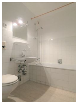
Bad mit Badewanne!