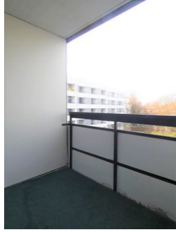
Für sonnige Momente!