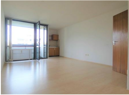
Ein Raum mit vielen Möglichkeiten!