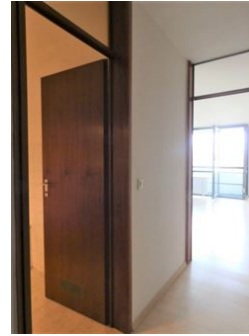
Heimkommen & Ankommen!