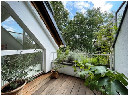
Kleine feine Dachterrasse