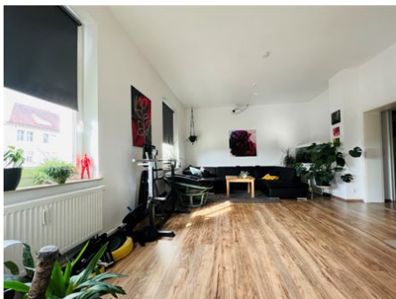
Viel Raum zur Entfaltung!