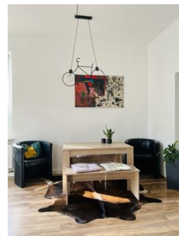
Hohe helle Räume