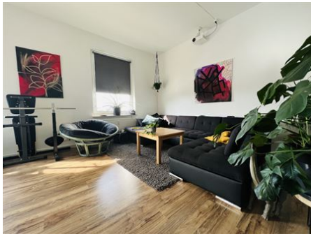
Offenes Wohnen | Essen | Leben