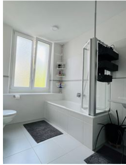
Schöne Böden! Viel Licht!