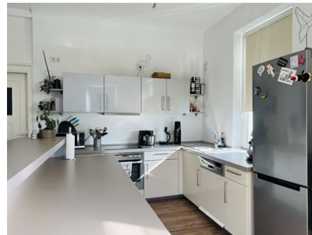
Viel Platz zum Kochen!