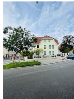
Vor dem Haus