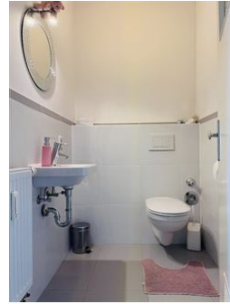
Alles was man braucht!