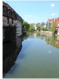
Super an der Großweidenmühle!