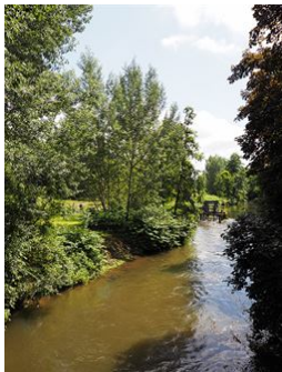
Gleich am Wiesengrund!