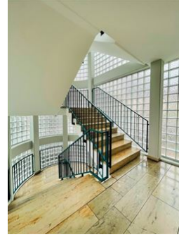
Viele schöne Details