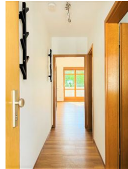
Ankommen und wohlfühlen!