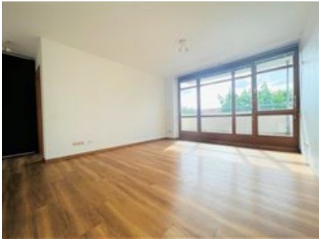
Die Sonnenseite des Lebens!