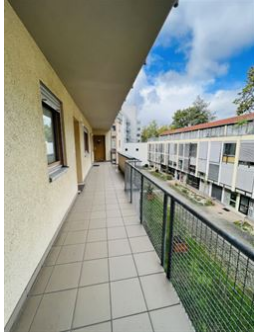
Alles im Blick!