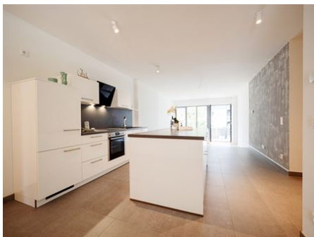
Hier bekommen Sie alles!