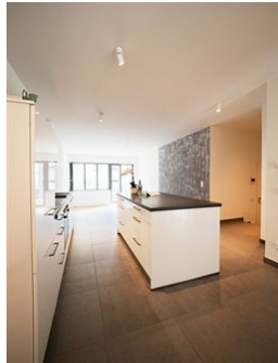
Etwas ganz Besonderes!