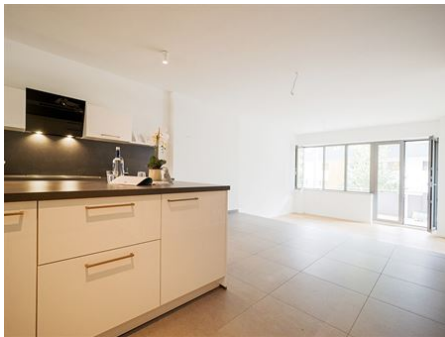
Offenes Wohnen | Essen | Leben