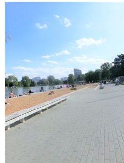
Wöhrder See Strand