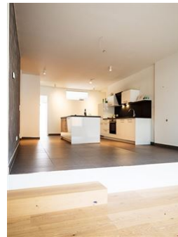
Offenes Wohnen | Essen | Kochen