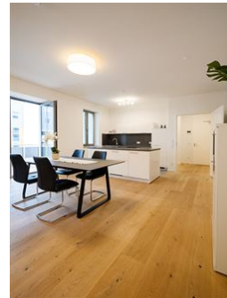
Offenes Wohnen | Essen | Leben