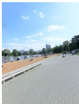
Wöhrder See Strand