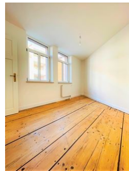
viele schöne Details