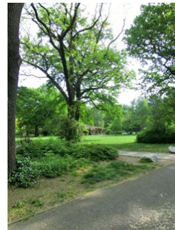
Stadtpark ganz nah!