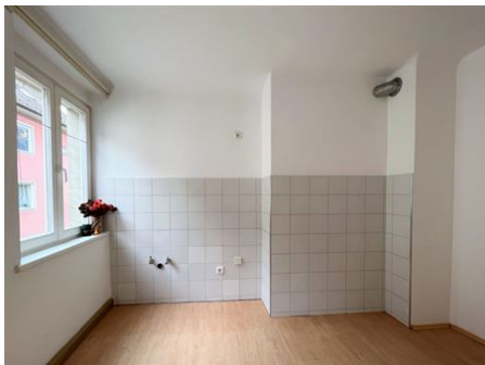
Mit Freude Kochen!