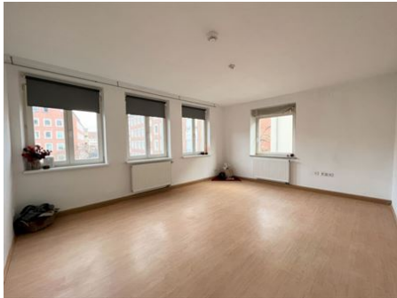
Wohnen leicht gemacht!