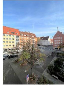
Mitten in der Altstadt!