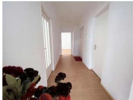
Die perfekte Aufteilung!