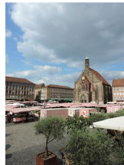
Die beste Altstadtlage!