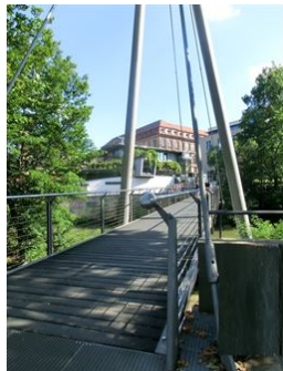
Auf ins Kino!