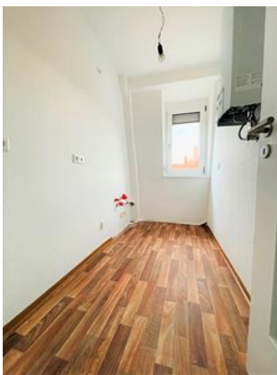
Kochen für Freunde!