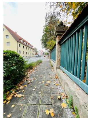
Auf zum Zimmermannspark!