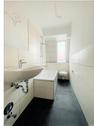
Neues Badezimmer mit Fenster!