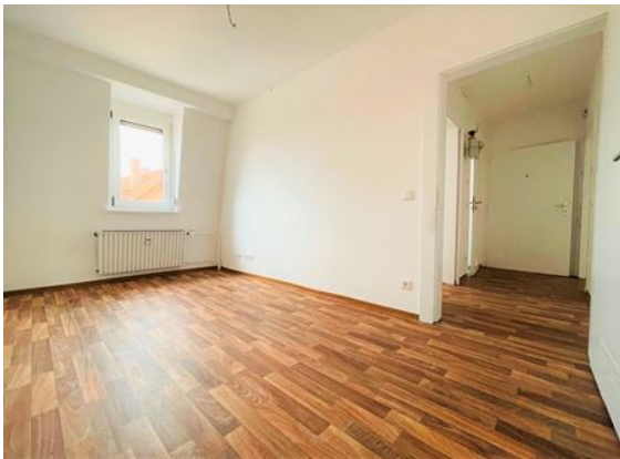
Homeoffice | Gast