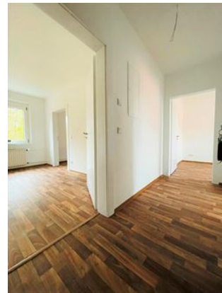
Heimkommen & Ankommen!